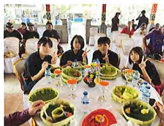
訪問団に参加した中学生