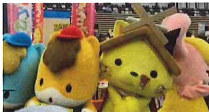
ご当地キャラ博2023 プロシードアリーナHIKONE 令和5年10月21日（土）・22日（日）