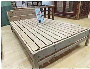
ヒノキすのこベッド

また日々行われる展示会やセミナー、ワークショップなどのイベントを通じて、木材に関する情報発信や交流が行われ、木材を使用した製品の魅力や可能性を発信しています。