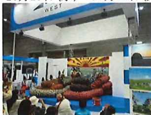
ツーリズムEXPOジャパン2023 インテックス大阪 令和5年10月21日（土）・10月22日（日）