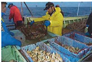
バイ籠漁業の漁獲状況

白バイ貝の漁獲時期は通年ですが、4船団のうち3船団は冬の三ヶ月間、「隠岐松葉ガニ（ズワイガニ）」漁に移行するため、一年を通してバイ籠漁を