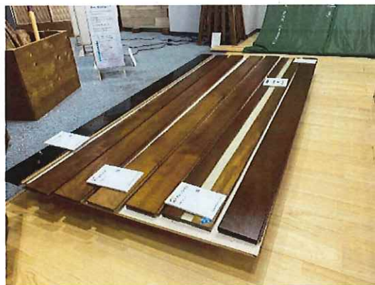
朴の木フローリング

ぜひ一度ご来店いただき、島根木材製品の持つ暖かさや美しさ、確かな技術に触れてみてください。日々の暮らしを豊かにするヒントがたくさん詰まっていますよ。