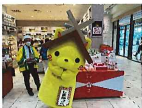
神在月・縁結びの國から 松江・出雲のおやつ 阪神梅田本店