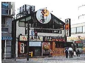
志な乃亭 天満橋店

白バイ貝の他、隠岐産、隠岐藻塩米、隠岐産サザエなども取り扱っています。（店舗によって取扱い時期が異なりますので、事前にご確認をお願いいたします。）