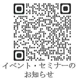
イベント・セミナーのお知らせ

ぜひ一度ご来店いただき、島根木材製品の持つ暖かさや美しさ、確かな技術に触れてみてください。日々の暮らしを豊かにするヒントがたくさん詰まっていますよ。