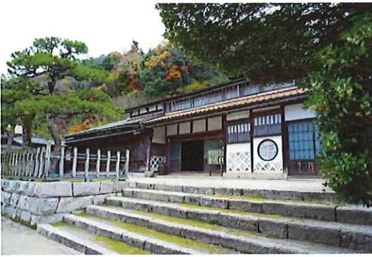
「VIVANT」ロケ地 櫻井家住宅（奥出雲町）

ストーリーの重要な位置づけで島根が登場し、撮影の一部が県内でも行われました。主なロケ地は、奥出雲町の櫻井家住宅、出雲大社、松江市の旧大谷小学校、島根県庁周辺などで、島根県、県観光連盟、県内市町村などで組織する「島根フィルムコミッションネットワーク会議（以下「島根FC」）」が、現地調整や、エキストラの手配などで協力しました。