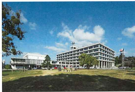
「VIVANT」ロケ地 島根県庁周辺

ロケ地となったきっかけについては、福澤監督が、インタビュアーで、世界に向けて投げかけたこのドラマには、島根の景色が必要であると発言され、最初のご縁となった奥出雲町の皆様とのエピソードを紹介されています。