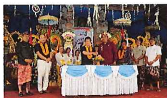
2023年記念式典（マス村）

そして、2030年に開催される国民スポーツ大会のカヌー競技会場に美郷町が選定されたことから、現在、会場を建設しています。会場には記念モニュメントとしてバリ島を象徴する「割れ門」の設置や、壁画アートスポットを制作する予定で、壁画アートにはバリ島で活躍しているアーティストMONEZ氏を招致し、美郷町のこれからの未来をつくる象徴的なスポットとしていきます。