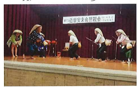
懇親会の飛び入りの「どじょうすくい踊り」

聞き慣れた調子に乗っての、どじょうすくい踊りでは、飛び入り参加のユーモラスなく踊りに皆さん笑顔笑顔で、ふるさとに思いを馳せながらの楽しいひとときでした。