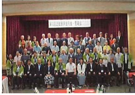
R5. 9. 30 第13回近畿安来会総会・懇親会集合写真