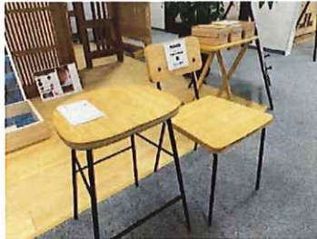
座面に三層パネルを配したスツール&チェア