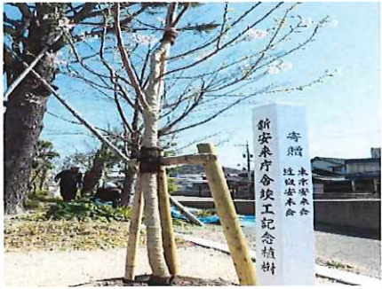
安来市役所新庁舎竣工記念として東京安来会と共同で植樹した桜の木（市の花）。神代曙（ジンダイアケボノ）という種類で年々成長し春には鮮やかな花を咲かせて訪れる人を楽しませてくれる。

なくされました。やっと、再開できる状況となりましたのでこれから色々楽しみな企画をしてまいりたいと思います。また令和2年には東京安来会と共同で、市役所の新庁舎竣工記念として市の花「桜」の植樹をしました。これからも、近畿の地でふるさと安来の発展を応援してまいります。