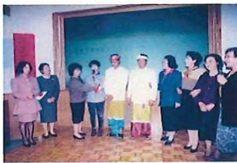
技術研修生の帰国

これをきっかけにバリ島マス村との交流が始まり、1993年友好都市協定を結びました。以降、訪問団