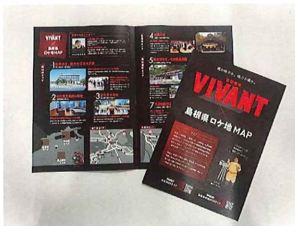
「VIVANT」×島根県ロケ地マップ

これまで島根が舞台となった主な作品には、アニメ映画「神在月のこども」(2021年 出雲市、松江市)、映画「高津川」(2019年 益田市、吉賀町)、テレビドラマ「コウノドリ2」(2017年 西ノ島町)等があり、神話ゆかりの歴史・文化、なつかしさを感じられる風景、隠岐諸島などの雄大な自然など、いずれも島根の魅力を生かした作品となっています。島根FCのウェブサイトで県内ロケ地の作品とロケ地の紹介をしておりますので、ぜひ一度ご覧いただきますと幸いです。