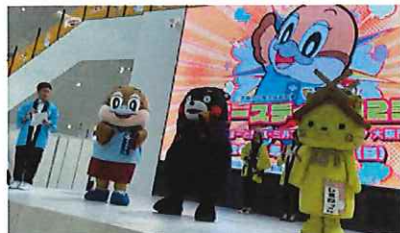
もずやんバスデー 三井ショッピングパークららぽーと門真 令和5年10月8日（日）