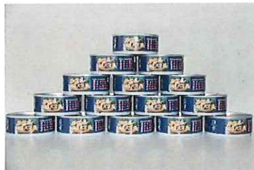
隠岐白バイ貝缶詰

「隠岐白バイ貝」イベント販売 昆陽池まつり（伊丹市）、豊中まつり、池田市商業祭など県外イベントでも岩ガキ、サザエとともに白バイ貝の販売・PRを行っています。