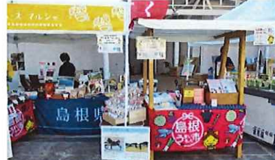
中四国9県観光物産展 みのおキューズモール 令和5年9月23日（土）・24日（日）