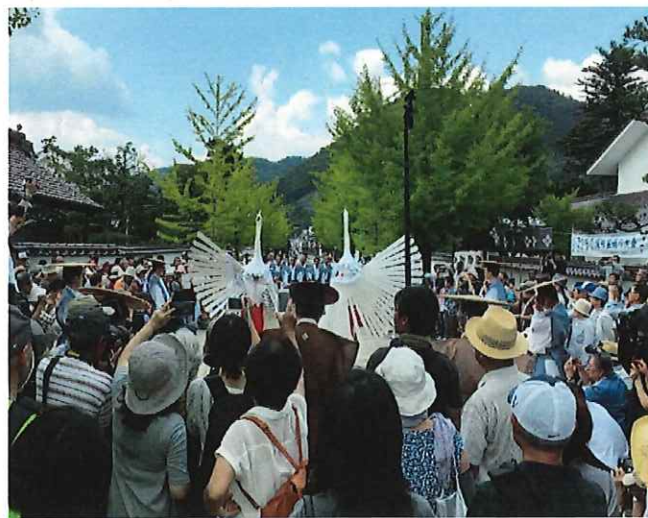
鷺舞の賑わい

鷺舞は「疫病鎮護」を祈願する舞といわれています。ユネスコ無形文化遺産となった優美な鷺舞によって、現代の疫病である新型コロナウイルスが終息へ向かうことを願ってやみません。