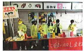
いくの未来お店バトル 大阪市 生野中央商店街 令和4年11月12日(土)