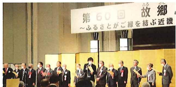
島根県民の歌「薄紫の山脈」「故郷」合唱