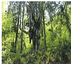
樹齢約800年 岩倉の乳房杉

この度ふるさと会の目的や活動内容を「かけはし」に掲載するチャンスを頂きましたが、前述したように活動に実態が伴わず活動報告が掲載できなかった事をお許し願います。