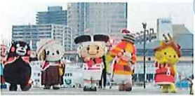
くまもんファン感謝祭 神戸市メリケンパーク 令和4年12月 3日(土)・4日(日)