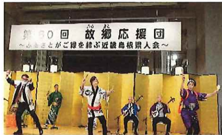
第60回 故郷応援団 隠岐民謡 (令和4年10月23日)

港又は出雲空港から飛行機を利用するのが一般的です。隠岐の島町の人口は、一三、六〇三人（男性・六六五九人、女性・六九四四人、※令和四年十月末現在）ですが、機会がありましたら是非ともご来島下さい。往来も思うように出来なかつたのですが、今年は多くのメンバーが隠岐の島町に興味を持っていただくような活動をしてまいります。