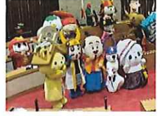
ご当地キャラ博 滋賀県彦根市 令和4年10月 22日(土)・23日(日)