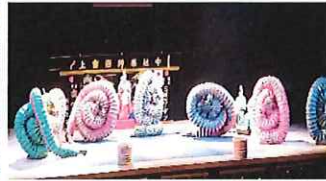
益田市石見神楽「石見神楽の舞」 豊中市 文化芸術センター 令和4年10月15日(土)