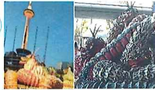
大田市石見神楽「大蛇の舞」 京都市 JR京都駅前広場 令和4年11月2日(水) ※同日、オペラ「石見銀山」 京都劇場にて上演。