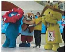
もずやんパレード 吹田市 EXPOCITY 令和4年10月8日(土)