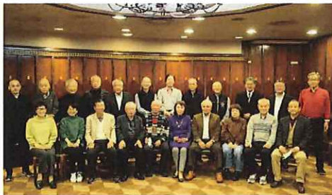
ふるさと会 役員会 (令和4年12月4日開催)

「ほっと一息、安らぎの島」島根半島の沖合日本海に位置する島後が故郷です。隠岐の島町への交通手段は、七類港又は境港から船を利用か、伊丹空