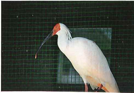
朱鷺（出雲市トキ公開施設）

国の特別天然記念物であるトキは、国内では一度野生絶滅しましたが、中国から提供されたトキの子孫を繁殖させることで個体数が回復、二〇〇八年からは新潟県佐渡市（佐渡島）で放鳥されるようになり、現在、佐渡島では五〇〇羽以上の野生のトキが生息しているとされています。しかし、生息範囲が佐渡島からなかなか拡大しないことが課題となっており、本州での放鳥の必要性が増していることから、環境省が放鳥候補地を公募し、このたび出雲市が選定されました。