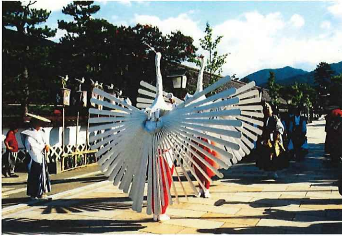
優美な雌雄の鷺舞

令和四年十一月三十日にラバト（モロッコ）で開催された第十七回ユネスコ無形文化遺産政府間委員会において、「津和野弥栄神社の鷺舞」を含む「風流踊」をユネスコ無形文化遺産へ登録する決議がなされました。島根県にとっては、平成二十一年の石州半紙（平成二十六年に「和紙・日本の手漉き和紙技術」として拡張登録）、平成二十三年の佐陀神能に続いて三件目のユネスコ無形文化遺産となります。