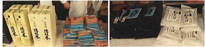
物産販売コーナー

また、物産販売コーナーでは島根県物産観光館や県内特産品メーカーより 「あらめ」 「あご粉末」 「サザエご飯」 「こじようゆ味噌」 「隠岐誉」 「宍道湖産しじみ」 「あご野焼き」 「石見の赤てん」 「板わかめ」 「新そば」 「若草」 「薄小倉」