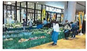
阪急オアシス産直市 キセラ川西店・SST吹田店 (毎週土日交互開催)