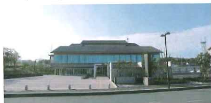
江津市新庁舎

江津市は、令和3年5月6日に新庁舎をオープンし、第6次江津市総合振興計画スローガン「小さくともキラリと光るまち「ごうつ」の基本理念を関西江津会としても目的に今後とも会員の相互親睦を深めると共に江津市の発展に寄与できること、新型コロナウイルスの早期終息を念願しております。