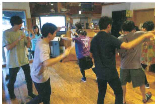
島民との交流(キンニャモニャ民謡)

滞在期間中、基本的には町内の事業所から個人の希望やスキルに一致した現場をマッチングした上でお仕事をしていただいております。それと同時に、せっかく離島に中長期滞在をしていただくので、ただ働くだけでなく島民との関係を構築していただきたいと思います。私たちは雄大な自然景観だけではない海士町の暮らしの魅力が島民とのつながりから感じることで、参加者の皆様の滞在がさらに色濃いものになっていくと考えているからです。