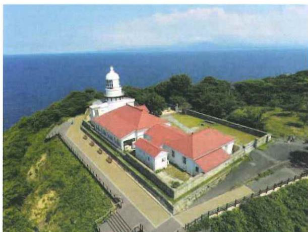
美保関灯台

島根半島の東西両端に位置する美保関灯台（松江市美保関町美保関）と出雲日御碕灯台（出雲市大社町日御碕）が2月9日に国の重要文化財（建造物）に指定されました。島根県内では、平成23年に八幡宮（津和野町）が指定されて以来、約10年ぶりの指定で、県内の重要文化財（建造物）は今回の指定により26件となりました。そこで、重要文化財指定を記念し、両灯台を紹介したいと思います。