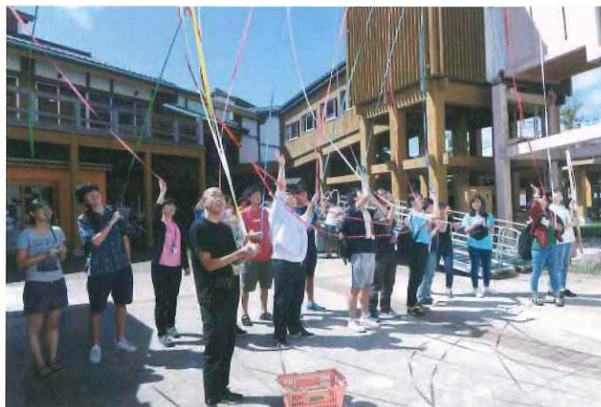
離島ワーホリ参加者お見送り(菱浦港)

中長期滞在のなかで、観光客から島民へと視点が変わり、島の日常を実感することができるようになる、実際に島に住所を移さなくても、島ならではの暮らしの魅力に触れることができる。観光よりも濃密で、移住よりもお手軽な暮らしの体験サービス、それが「離島ワーホリ」の魅力です。