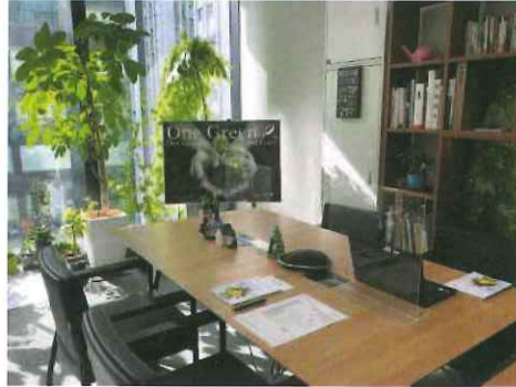
土曜相談会会場「まちらボ Dルーム」