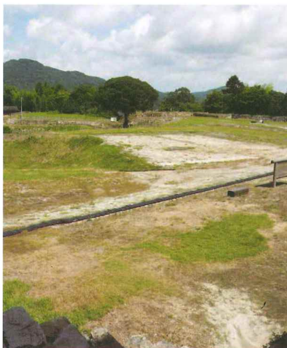
月山富田城 山中(さんちゅう)御殿