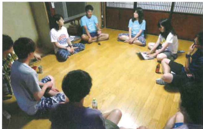
離島ワーホリ参加者(シェアハウスでの交流)

これまでも沖縄を除く46都道府県、またイタリヤやドイツ、台湾など世界中の方にご参加をいただいております。参加者の年齢層も学生さんを中心に10代から60代と幅広く、離島ワーホリは参加者の皆様にとつて多様なあるつながりが生まれる機会のひとつとなっております。