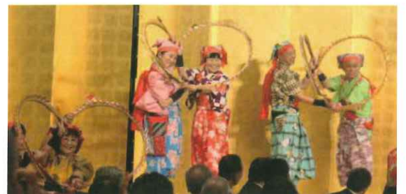
「故郷応援団～みんなで楽しむ近畿島根県人会～(懇親会)」の様子(2019年11月)