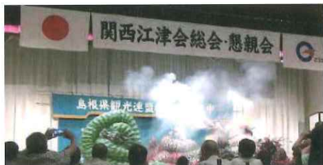
関西江津会総会・懇親会(神楽)

関西江津会結成以来、今日まで15回の「総会・懇親会」を毎年7月の最終日曜日に大阪市都島区の太閤園で開催して来ました。(令和2年と3年は新型コロナウイルス感染症予防および拡散防止のため中止しています。)