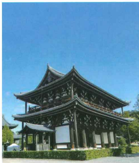
東福寺(京都市東山区)