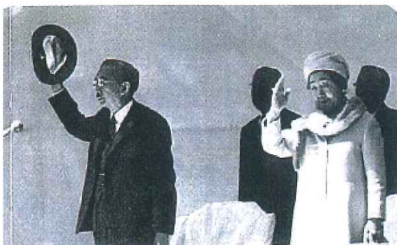
前回の植樹祭の様子

昭和46年4月18日、大田市の三瓶山北の原において、天皇后両陛下をお迎えし、第22回全国植樹祭を開催しました。