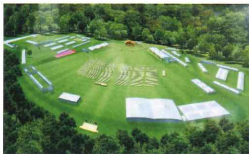
開催会場のイメージ図。招待者は約4千人でこのうち約1150人は県外から訪れます。

島根県では昭和46年の第22回大会に続き、今回で2回目。平成3年には同じ会場で第15回全国育樹祭も開催されました。来春の第71