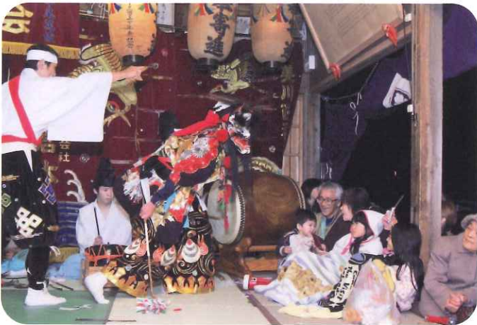
奉納神楽を楽しむ人びと

へささげる古来からの神楽を守り続ける一方で、時には新たな舞を創造し、発展してきました。現在では、石見各地の地域のイベントなどでも年間を通じて盛んに舞われ、週末になればどこからか神楽囃子が聞こえてきます。