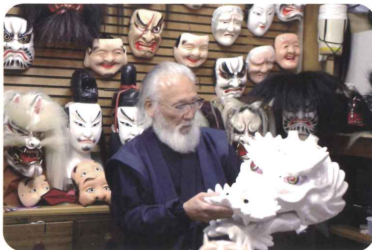
石見神楽面の製作工房

老若男女、観る者を魅了する神楽は地域とともに歩み発展してきた、石見人が世界に誇る宝なのです。