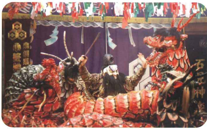
石見神楽 演目「大蛇」

日本遺産は、文化庁が地域の歴史的魅力や特色を通じて我が国の文化・伝統を語る「ストーリー」に対して認定するもので、現在で83件が認定されています。