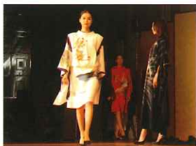
ヒトシタムラさんによるファッションショー