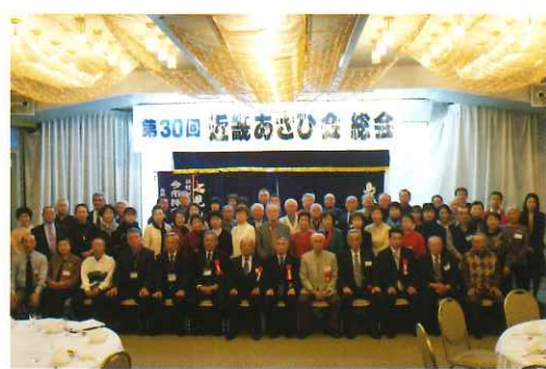
近畿あさひ会総会集合写真

今のところ、会員の知人による賛助者を募るなど同期会同窓会の場として親睦を深めていただくように検討している所です。ほかのふるさと会の皆様よりご指導ご鞭撻をお願い致します。