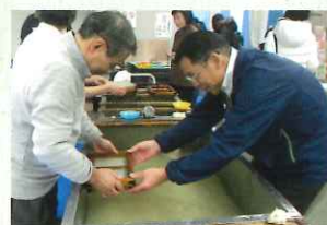
紙漉き体験指導を行う

URL: http://sekishu.jp/kubota/ TEL:0855-32-0353