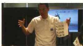
島根県へのUIターン希望者も参加され、定住や石州和紙の話を行う

日本海の荒波は一度見たら忘れられません。この荒波の下で生き物は鍛えられ育っていくでしょう。百歳人生皆さんも島根で若返って元気になってください。