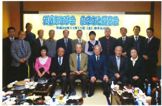
ふるさと同窓会集合写真

旭町も平成十七年に浜田市と合併して近畿あさひ会も存続することに大変苦しんでいます。