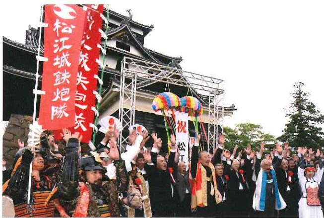
H.27.5.15国宝指定答申日の松江城