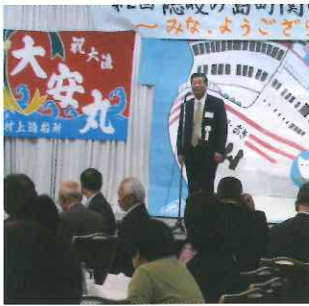
第2回総会(太閤園にて)

去る、6月21日太閤園に於いて第2回の総会を開催。当日は故郷でウルトラマラソンの第10回記念大会があったにも拘らず多数のご出席を頂き