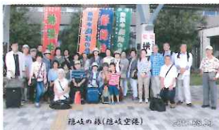
隠岐の旅(隠岐空港)