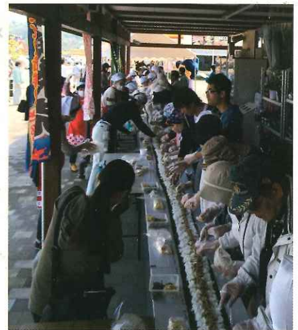
サンピコごうつ5周年風景

ミラノ亭では、料理二筋でやってきた父のもと、洋食を基本とした惣菜やお弁当などを販売しています。また、地域のイベントなどに出席したり、食育に関連した料理教室などにも携わらせて頂いています。イターンし二年が過ぎた頃に江津市で開催されたビジネスプランコンテストに出場、受賞したのを契機に地元で農業をはじめ、「地域の食を知ること」「生産者と消費者のかけはしになること」ができればと、日々模索しながら活動しています。同時期に、江津青年会議所という地域団体にも入会し、地域で活躍する青年経済人と共に切磋