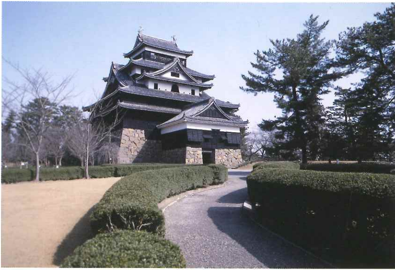
千鳥破風の美しさから別名「千鳥城」とも呼ばれる

松江城天守は昭和10年に国宝保存法により国宝に指定されましたが、昭和25年の文化財保護法の制定により、重要文化財となりました。松江市では昭和26年から国に国宝指定の陳情を繰り返してきました。平成20年には松江市長が松江城国宝化に向けての市民運動の醸成を提唱され、同21年には「松江城を国宝にする松江市議会連盟」、「松江城を国宝にする市民の会」が相次いで設立され、同22年1月からは