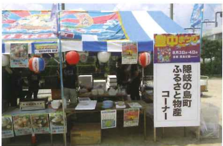
2019年豊中まつり(出展ブースの様子)