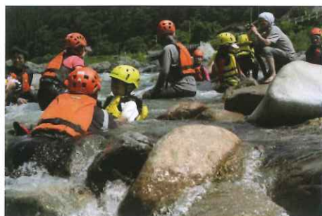
高槻市親子キャンプ

県西部に位置する益田市は、大阪府高槻市・大阪府豊中市とそれぞれ姉妹都市・友好都市として交流しています。高槻市との交流は、昭和46年に旧匹見町（平成16年に益田市に編入合併）の頃に「過密の高槻市」と「過疎の匹見町」の相反する都市問題がきっかけとなって始まりました。また、豊中市とは、市内に位置する伊丹空港と益田市の萩・石見空港との間に夏季限定便が運航していることから、平成25年に「空港で結ぶ友好都市提携に関する協定」を、また同年には「災害時の相互応援に関する協定」を締結し、空のつながりが街のつながりへと広が