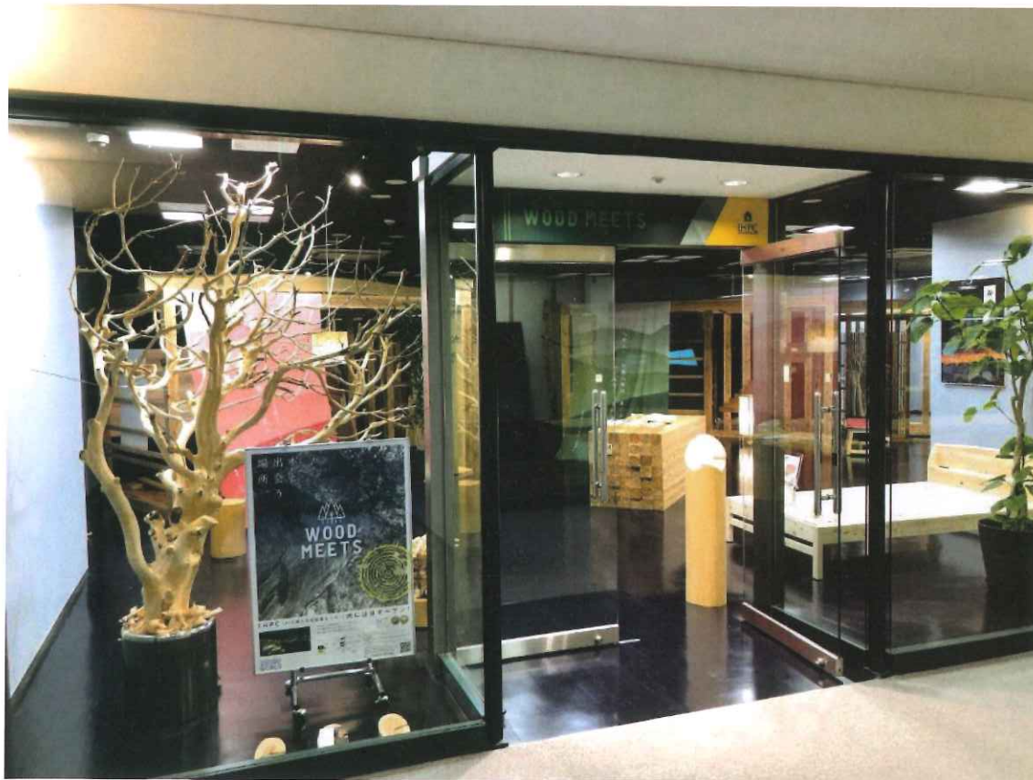
アジア太平洋トレードセンター島根木材常設展示場