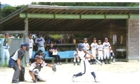
2017年ごんせCUP(決勝戦の様子)