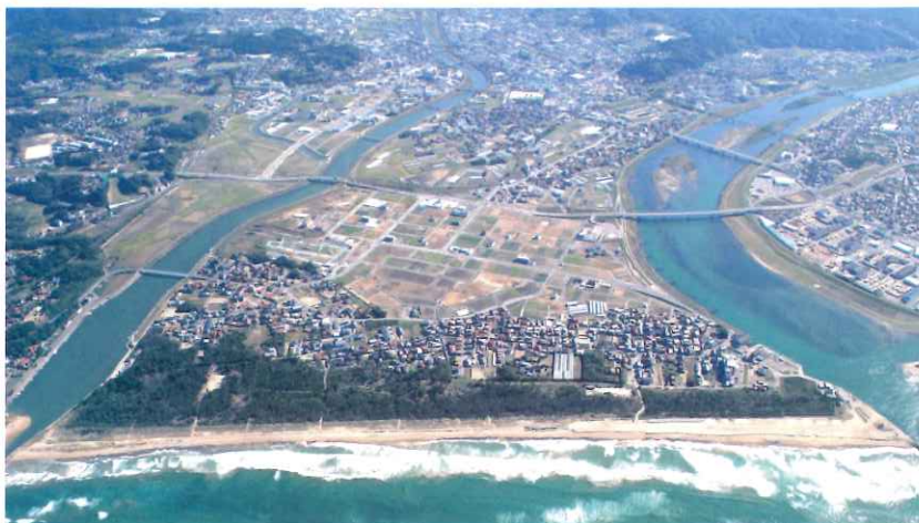
益田平野の航空写真