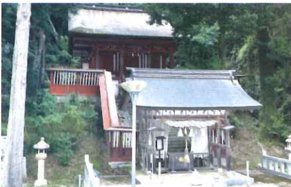
染羽天石勝神社本殿