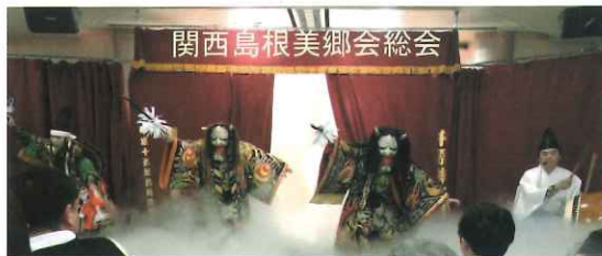
関西島根美郷会総会