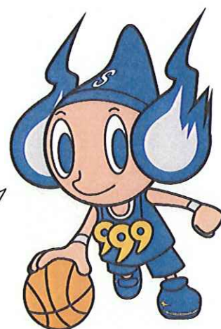
マスコットキャラクター「すさたまくん」