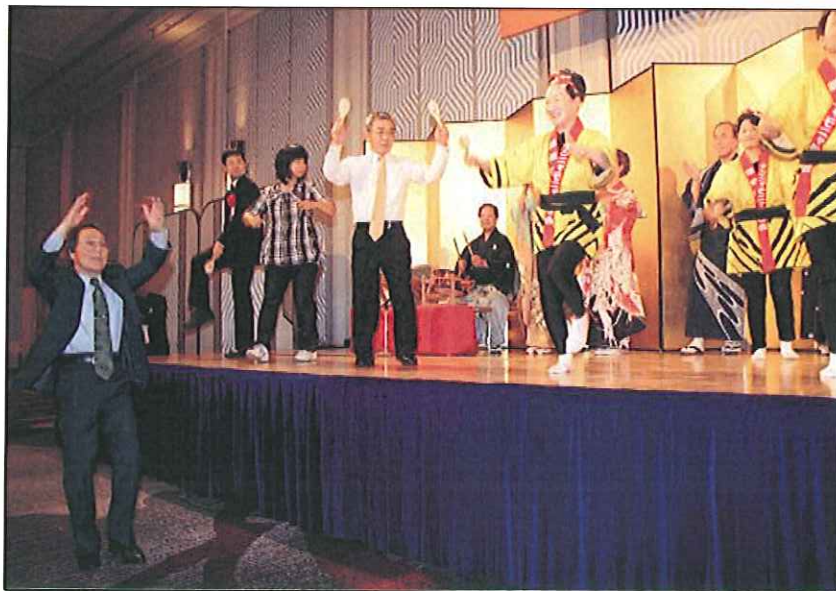
第46回近畿島根県人会総会・キンニャモニャ踊り

隠岐は、北前船が海運の主力をなした、江戸末期から明治初期にかけては、風待港、補給港の要所として、本土を凌ぐ活況を呈し、明治元年には、隠岐国郡代を追放し、自治政府を造らんと騒動（隠岐騒動）を興し、僅かな期間ではありましたが自治政府を成したくらい、経済的にも政治的にも元気な時代がありました。ところが今はその面影すらもなく、過疎の一途を辿り、狸に政権を奪われかねない村もあるくらいです。 でも、関西隠岐人会は、自然と人情味溢れる隠岐の島をこよなく愛す、故郷（ふるさと）応援団として、隠岐の地域振興に少しでもお役に立てたらと願い、各町村と綿密にコンタクトをとりながら、楽しく元気に活動しております。