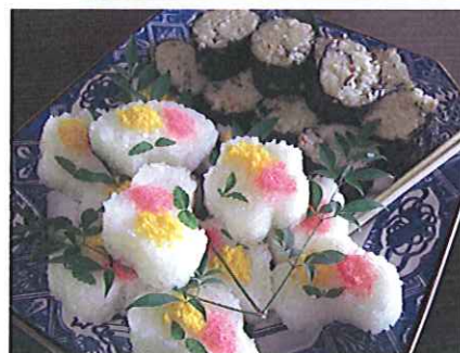
佐々木家・昼食の「コマ

おわりに、今回の旅では四町村（行政）の皆様と個別に意見交換する有意義な機会を得ました。お忙しい中での時間を調整して頂き厚く御礼申し上げます。