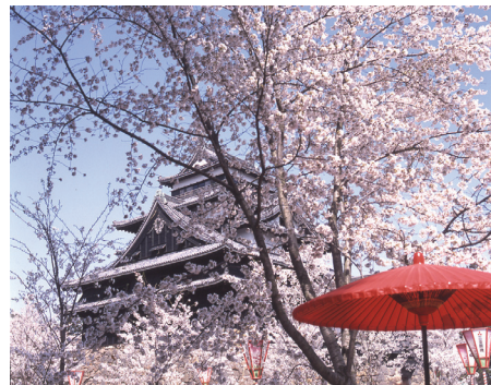
松江城・お城まつり