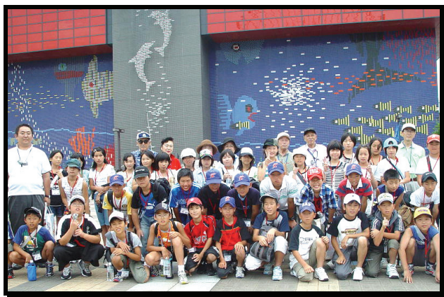
第7回 浜っこ関西ツアー (海遊館前にて)

このような生徒たちからのお礼の手紙に励まされ癒されながら、また、われわれを育んだ山紫水明の故郷への感謝と報恩を感じつつ、二十数名の理事（役員）でこうした行事を浜田市と綿密にコンタクトをとりながら実施しております。