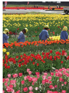
「はくたチューリップ祭り」安来市伯太町