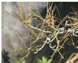
クロマツ褐斑葉枯病

また、公園や庭に植えた木に病気が出たり、虫が付いて木が枯れたり弱ったりして、どうしたらよいか困ることがあります。こういった県民の皆様からの様々な「木の病害虫」の質問にお応えしています。これが島根県全域に広がるかも知れない病害虫の早期発見につながることもあります。