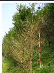
輪紋葉枯病による激しい落葉