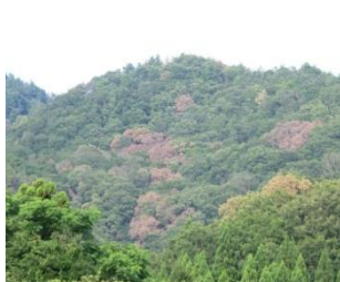
ナラ枯れ(ブナ科樹木萎凋病)

カシノナガキクイムシにより運ばれる伝染病です。コナラなどの大きな木が集団で枯死することがあります。