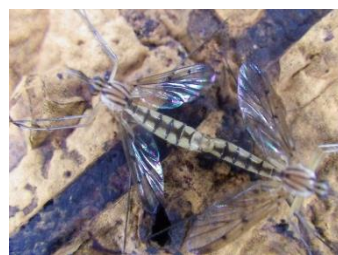
ナガマドキノコバエ

カシノナガキクイムシにより運ばれる伝染病です。コナラなどの大きな木が集団で枯死することがあります。