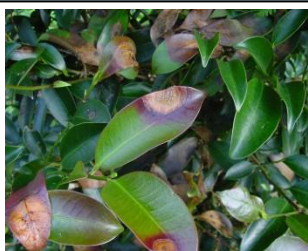
サカキ栽培園で発生した輪紋葉枯病

診断依頼のあった被害の診断をおこなっています。その中で今後、注意すべき被害については現地で詳しく被害状況・加害生物の生態などを継続して調査しています。