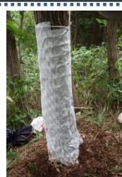
不織布の粘着シート

カシノナガキクイムシの捕殺試験 粘着シートを使った、簡易な駆除方法を試験しています。数種類の粘着シートを使用し、捕虫効果の高い素材や設置方法を試験します。