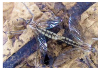
ナガマドキノコバエ 菌床しいたけ栽培施設で発生し、 しいたけの食害や異物混入など の原因となります。