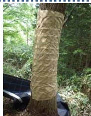
粘着シートの設置