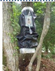
カシノナガキクイムシに対す る捕殺試験 粘着シートを使った、簡易な 駆除方法を試験しています。