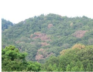
ナラ枯れ カシノナガキクイムシにより運 ばれる伝染病です。コナラな どの大きな木が集団で枯死 することがあります。