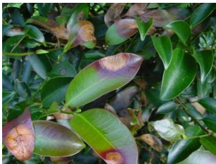
サカキ栽培園で発生した輪紋葉枯病

診断依頼のあった被害の診断をおこなっています。その中で今後、注意すべき被害については現地で詳しく被害状況・加害生物の生態などを継続して調査しています。