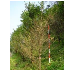
輪紋葉枯病による激しい落葉