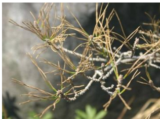
クロマツ褐斑葉枯病 糸状菌の感染によって葉が枯 れます。苗畑・庭園に発生し、 木が枯死することもあります。

また、公園や庭に植えた木に病気が出たり、虫が付いて木が枯れたり弱ったりして、どうしたらよいか困ることがあります。こういった県民の皆様からの様々な「木の病虫害」の質問にお応えしています。これが島根県全域に広がるかも知れない病虫害の早期発見につながることもあります。