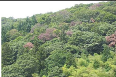
浜田市の被害木(葉が褐色に変色)

防除には病気を媒介するカシノナガキクイムシの数を減らすことが必要です。被害木を1本ずつ駆除したり、保護する木を1本ずつ防護資材などで処理する方法がありますが、実施可能な場所は公園などに限定されます。そこで広域の一般山林で実施できる新たな防除方法として、カシノナガキクイムシの集合フェロモンを利用して、この虫を大量に誘引駆除して被害を抑制する技術を開発します。