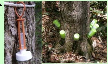
フェロモン・殺菌剤の設置・注入

そこで、人工合成したフェロモンを「おとり」となる木に設置して、カシノナガキクイムシを誘引します。おとりとなる木には、あらかじめ殺菌剤を注入しておき、木が枯れないようにして媒介昆虫を大量に駆除します。