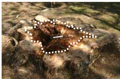
白線内で褐色に腐朽している。