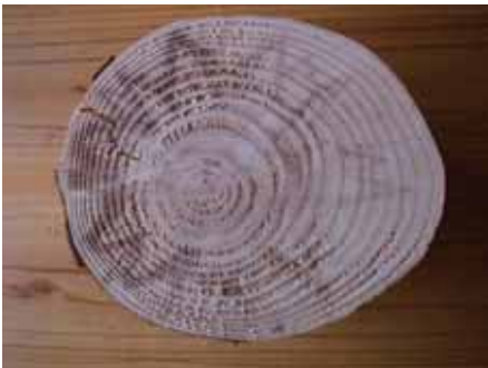
被害を受けたヒノキ。多数の寄生を受けた木は「星型」の模様になる。

スギ・ヒノキを伐ったときに、切り口に星形の変色が広がった材を認めることがあります。これはニホンキバチが生きた木に産卵したとき、同時に持ち込まれるアミロステレウム菌が増殖して変色したものです。材の変色による強度の低下はありませんが、製品の経済価値を低下させる被害が発生します。この被害は木を伐ったときに初めて変色が確認できるやっかいな被害です。この被害回避方法を提示することを目的に、島根県での被害実態調査とニホンキバチの生態を調査しました。