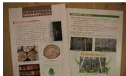
作成した被害回避マニュアル

本県のスギ・ヒノキ材がニホンキバチによる材変色被害を受けないように注意を喚起する必要があります。このため、森林所有者や森林組合等の森林施業従事者へ、本被害の実態・被害回避方法を普及して、被害対策の重要性を報告しました。また、このための普及試料として「ニホンキバチによる材変色被害回避マニュアル」を作成しました。