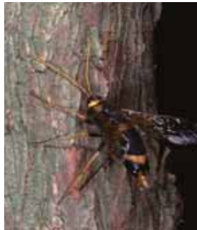
産卵するニホンキバチ。同時にアミロステレウム菌が感染。