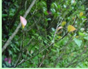
写真2 輪紋葉枯病。落葉が激しい。