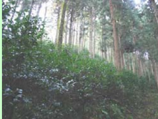
写真1 スギ林内での栽培の様子。

島根県では、シキミ、サカキなどの枝物がスギ・ヒノキ林や天然林の林間を利用して栽培され、県内外の市場に出荷されています。しかし、高収益・供給不足でありながら、栽培技術が未確立で、生産額のアップにはまだまだ課題が多いです。この研究では、収穫に大きな影響を及ぼす2つの病害（輪紋葉枯病・枝枯病）について研究し、生産性の向上を目指します。