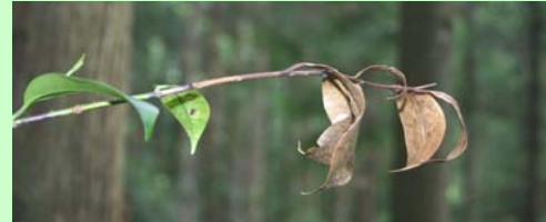
写真3 枝枯病。病原菌など不明。