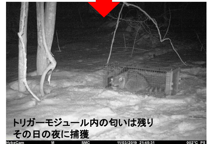
トリガーモジュール内の匂いは残り その日の夜に捕獲

踏板を使用しないため、ネコや鳥が侵入しても扉が作動にくい設計。 撒き餌が食べられても、トリガーモジュール内の餌の匂いで誘引、捕獲活動が継続できます 今まで使いにくかった肉・魚・ペースト系の餌が使えます