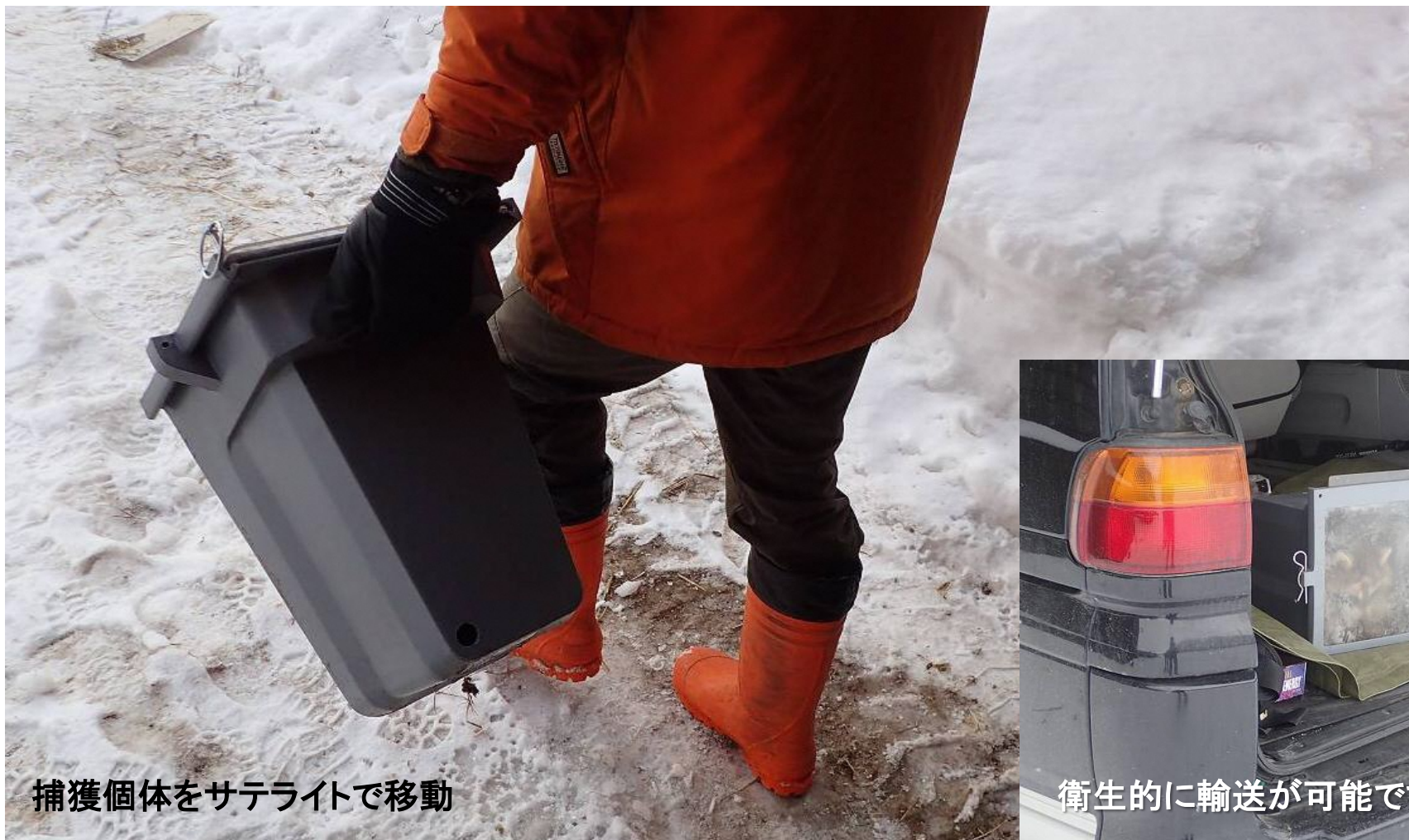
捕獲個体をサテライトで移動