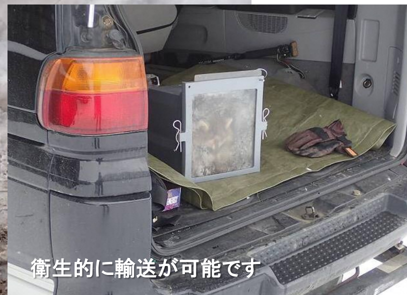
衛生的に輸送が可能です

不衛生なわなを持ち歩かなくてよく、清潔に移動できます 引っ搔かれることなく安全に移動することができます わなよりもコンパクト