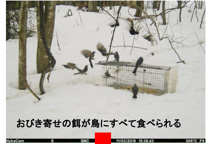
おびき寄せの餌が鳥にすべて食べられる