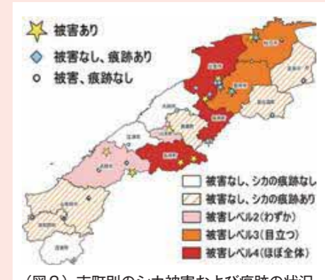
（図2）市町別のシカ被害および痕跡の状況