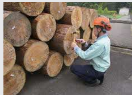
（写真3）簡易型測定器による測定