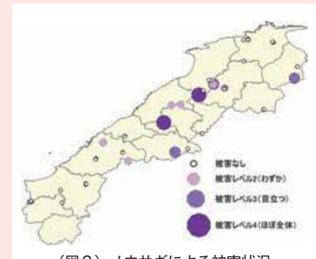
（図3）ノウサギによる被害状況