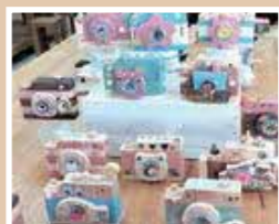
【木のおもちゃカメラ作り】