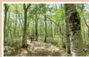
大万木山のブナ林