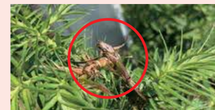
（写真4）刃物で切ったようなノウサギの食害跡