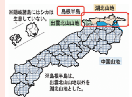
（図1）ニホンジカ生息エリア図

県では「伐って・使って・植えて・育てる」循環型林業を推進していますが、今後、新たに植えた苗木がシカに食害され、育たないことが懸念されます。そこで、シカの生息状況や被害実態を把握して効果的な対策が実施できるよう、県内のシカによる被害状況や痕跡を調査しました。同一調査地において、生息情報が増加しているノウサギ（写真3）の被害についても併せて調査を実施しました（今回、隠岐諸島におけるオキノウサギの被害は調査対象としていません）。