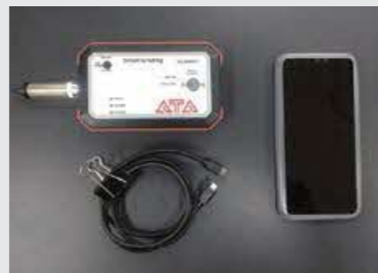
（写真4）市販の簡易型測定器一式