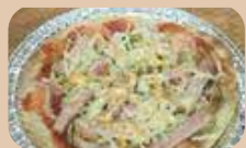
もっちり食感に大満足