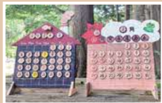
【木のボードカレンダー作り】 夢中で作業される様子が印象的でした。