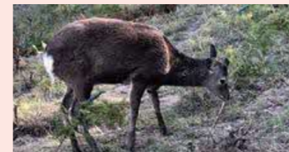
（写真1）ヒノキを食害するシカ

植えてから5年が経過するまでの若い植栽木では、ヒノキやコウヨウザンの食害が多く確認されました。被害の程度を1から4（「なし」、「わずか」、「目立つ」、「ほぼ全体」）のレベルに分けて評価（図2）したところ、松江市、出雲市、雲南市、飯南町、邑南町では、被害レベル3～4の被害が確認され、木が枯れていた場所もありました。植えてから年月が経過し、成長した林分では、松江市、出雲市、雲南市において、角で木を傷つける角こすり被害と、樹皮を剥いで食べてしまう食害が確認されました。