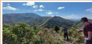
Mさん おすすめの等検境ルート

紅葉のタイミングと全く合わず残念でしたが、3講座とも澄み渡る青空と眼下に広がる眺望を楽しみました。