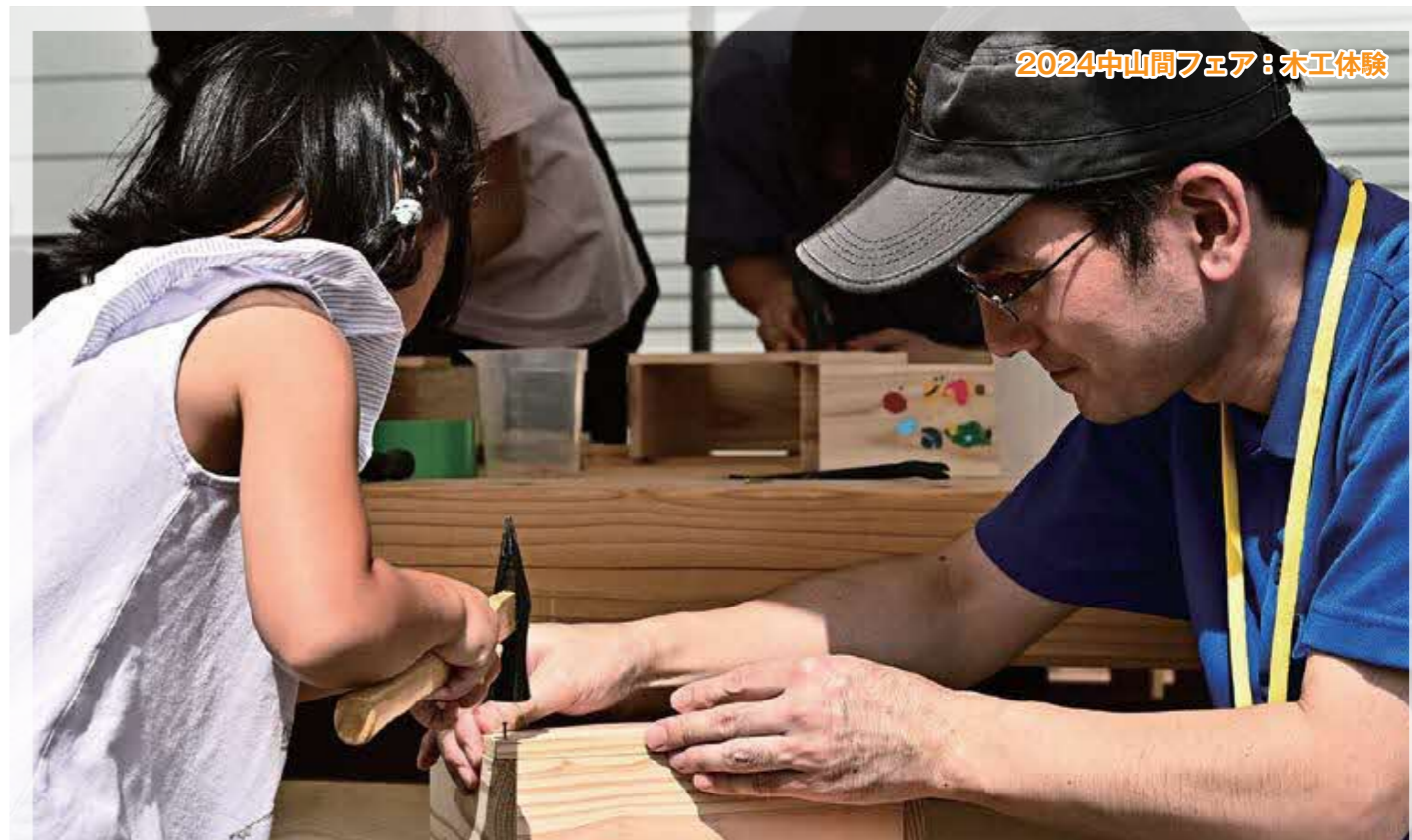
2024中山間フェア：木工体験