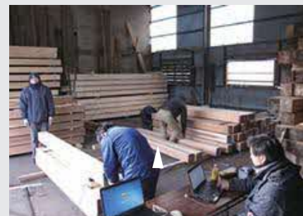
（写真2）通常の強度の測定方法