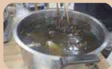
ヨモギの染液で草木染め