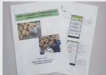
（写真1）作成した手引き