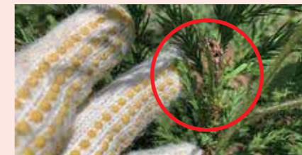
（写真2）引きちぎったようなシカの食害跡