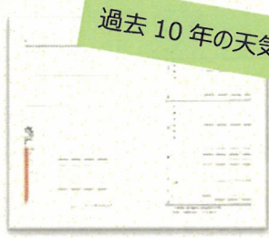
週間スケジュール