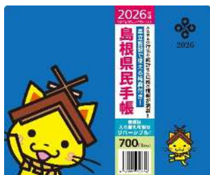
「2026年版島根県民手帳」 島観連許諾第8883号