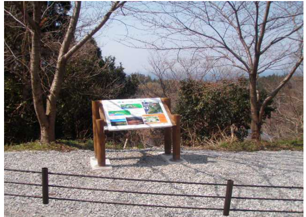
油井の池(地すべりでできた窪地)