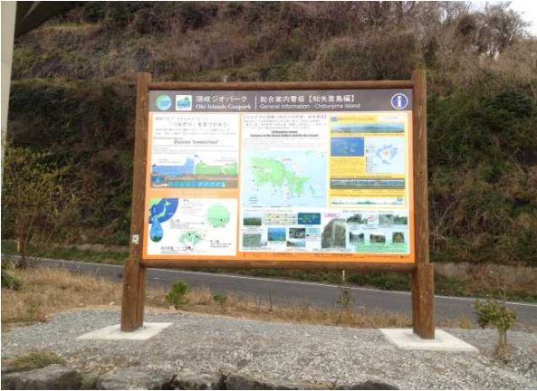
来居港(外輪山火山の岩石)