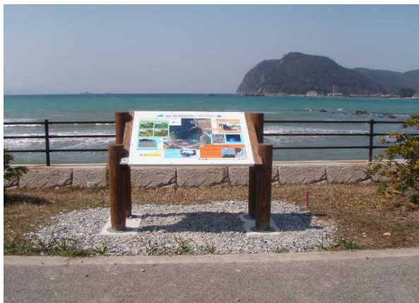
イカ寄せの浜(イカの掴み取りができる砂浜)