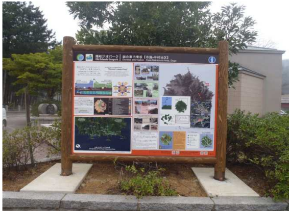
布施地区(総合案内板)