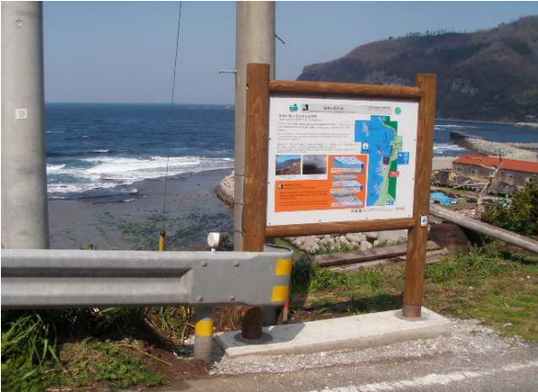
油井の前の洲(波蝕台とソシオナイトシート)