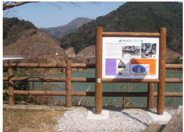
銚子ダムの片麻岩(日本最古の基盤岩)