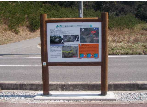
津戸の珪藻土(珪藻土と不整合)