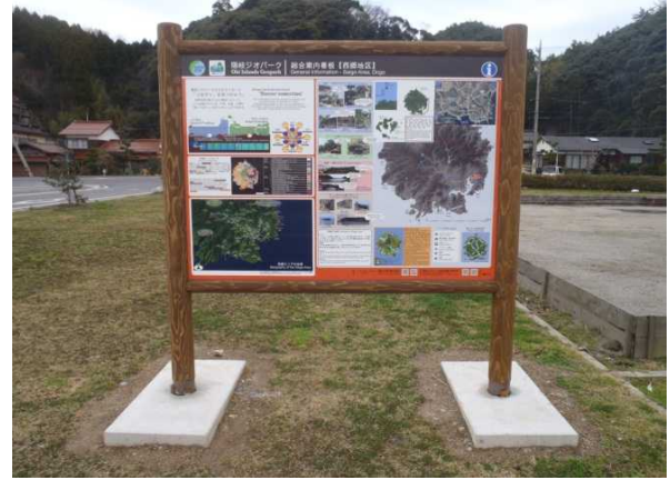
西郷地区(総合案内板)