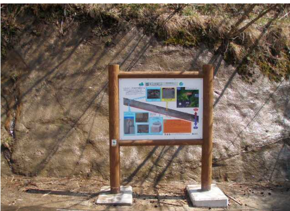
都万層の露頭(海の生き物化石が産出)