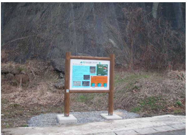
五箇石(湖の時代のグリーンタフ)