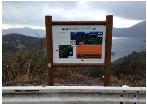
島前カルデラ(中央火砕丘と文覚窟)