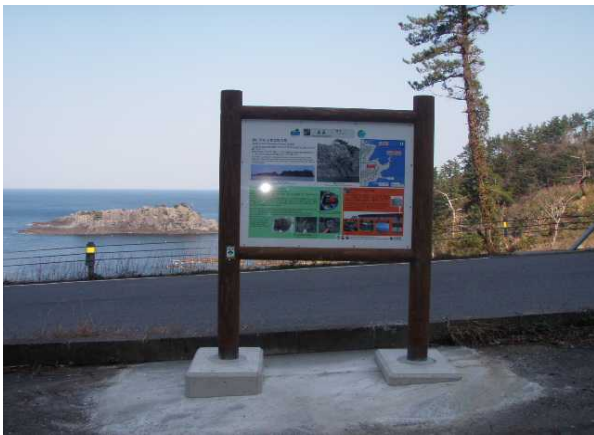
黒島(玄武岩の柱状節理の島)