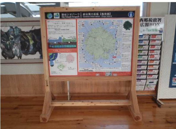
西郷港(総合案内板)