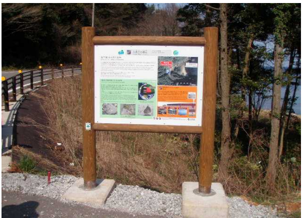
大久北玄武岩(マントルゼノリス)