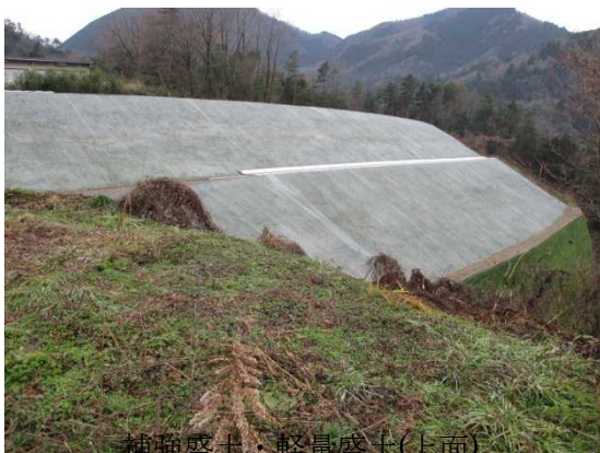
補強盛土・軽量盛土(上面)