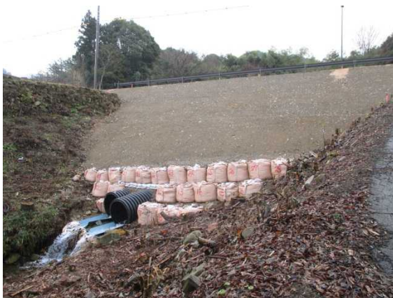
災害復旧(暗渠排水)