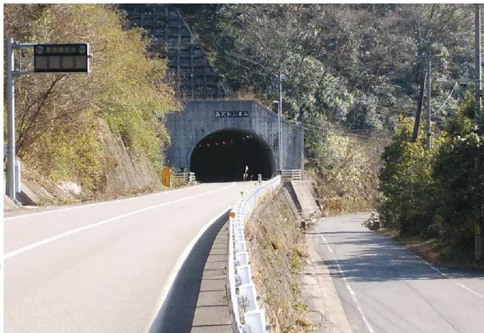
整備後 / 2車線のバイパスで所要時間が15分短縮