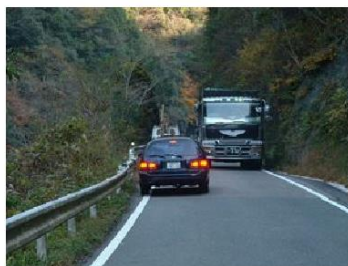
整備前(旧道) / 離合困難で大雨時には冠水が多発