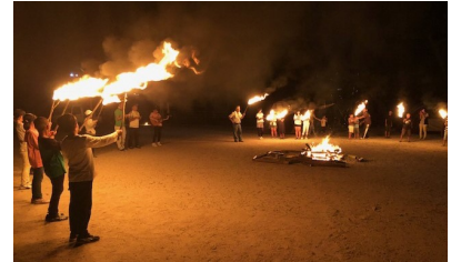
(子どもたちが松明を持って退場するフィナーレはとても感動的でした)

参加者に加え地域住民も集まり、大勢で火を囲んだ。司会役の進行のもと、まずは自然塾参加者の代表2名が松明を持って入場し、点火。「もえろよもえろ」を歌いながら次第に燃え上がる炎を見つめ、歌い終わったのちに、「猛獣狩り」などのレクリエーションを行って、参加者同士の親交を深めた。キャンプファイヤーの炎を使ったパフォーマンスや、花火大会もあり、参加者全員が楽しめる内容だった。