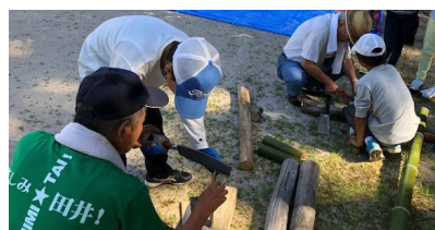
(ノコギリは引くときによく切れるぞ!!)