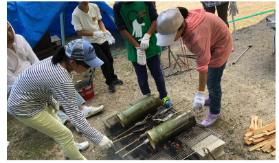
(焦げないように丁寧に焼き上げました)

竹細工で作った竹串でヤマメを刺し、焼き魚を作った。スタッフに串を刺す位置などを教わりながら作業したが、ヤマメは粘液でヌルヌルしており、串に刺すのに苦労した様子だった。