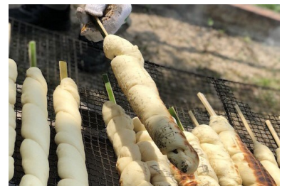
(パンはやっぱり焼きたてがうまい!!)

まずはパン生地を作成し発酵させ、前日に作った竹串に巻き付けて、釜戸で調理。スタッフの指導のもと、丁寧に材料を量り、力いっぱい生地をこねた。焦げないように、火のそばで竹串を回しながら丁寧に焼き上げた。