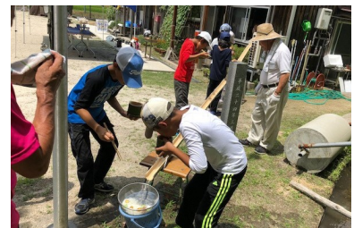
(トマトをつかむのが難しかった…)

そうめん流しを行った。そうめんだけでなく、トマトやジャガイモなどの野菜も流れてきて盛り上がった。8m弱の大きな竹は、非常に真っすぐで、節も丁寧にやすりで削られており、子どもたちが安全に楽しめるようにとのスタッフの想いが込められた一品だと感じた、