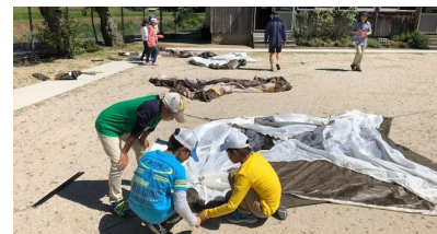
(試行錯誤しながらテントを組み立てました)

開講式、オリエンテーションを終えたのち、テントを設営。 スタッフが少し手を貸しながらも、説明書を見ながら子どもたちの力でテントを組み立てた。