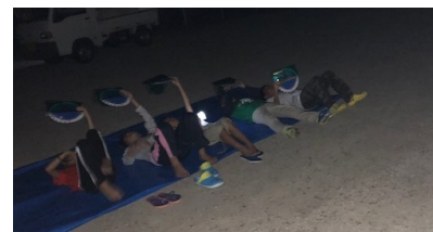
(雲もなく、たくさんの星が観察できました)