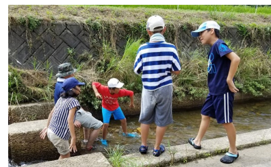
(水切りの最高記録は6回でした)

閉講式まで空き時間があり、近くの川で水遊びを行った。水切りや石積み遊びをして楽しんだ。中には蝶を追いかける子どももおり、最後の最後まで楽しめた様子だった。