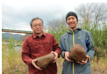
こんな石を使います

2016年から始めて、静間川の下流から3つの堰に、アユが通りやすい魚道を次々と整備していく計画です。河原の自然石を集めて魚道に貼りつける工事を行います。ボランティアワーク以外にも資材費や専門業者の工事費が必要です。