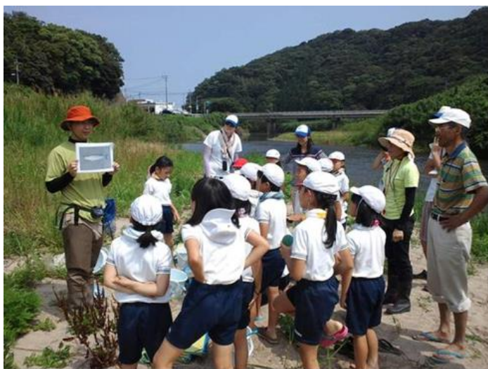
みーもスクール川の学習で子どもたちと生き物観察をしています