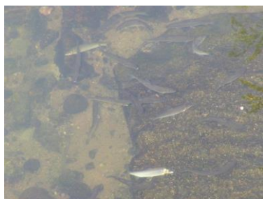
5年前にはアユがたくさん現れたこともありましたが、近年は激減しています。

アユはきれいな川にしか生息せず、清流の象徴としても有名な魚です。しかし近年は農業における取水で水量が少なくなったり、そもそも昔に作られた魚道が機能していなかったりして、アユは上流に登ることができず、下流部に留められたまま一生を終えることになってしまっています。