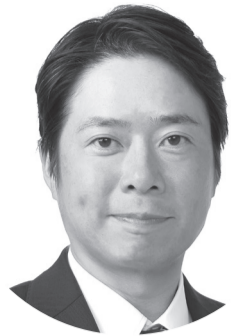
自由民主党公認候補