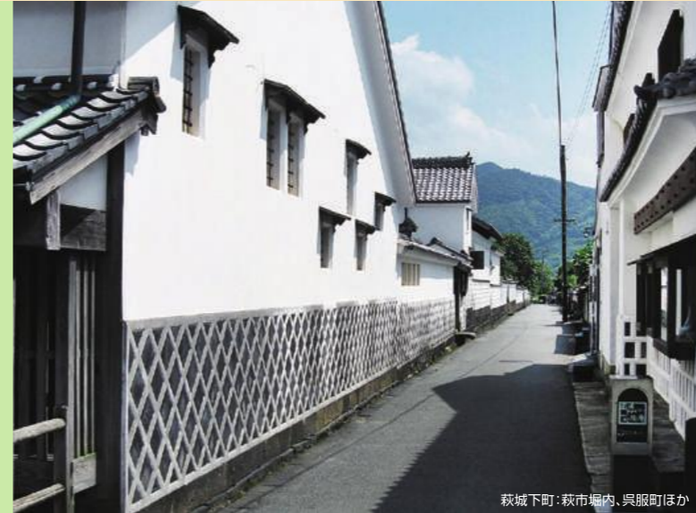
萩城下町：萩市内、呉服町ほか