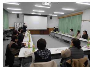
安協久野支部 女性部