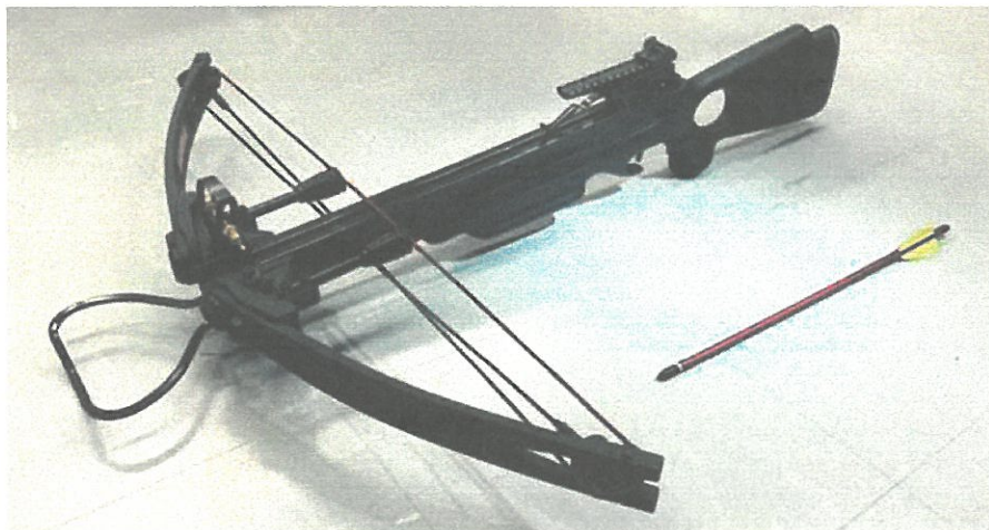
【クロスボウの写真】