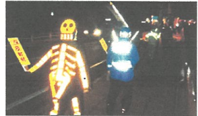
【キラリ推進隊活動状況】