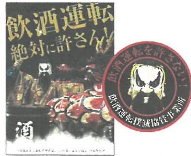
【飲酒運転根絶ポスター・ステッカー】