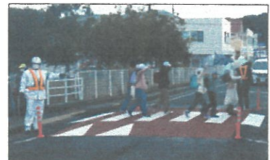
【スムーズ横断歩道】