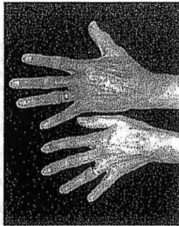
輸血後鉄過剰症の診療ガイド から引用