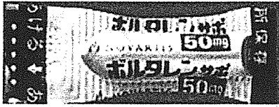
正常品のアルミシート

患者様ならびに医療従事者の皆様には多大なご心配をおかけしますことを、心より深くお詫びいたします。