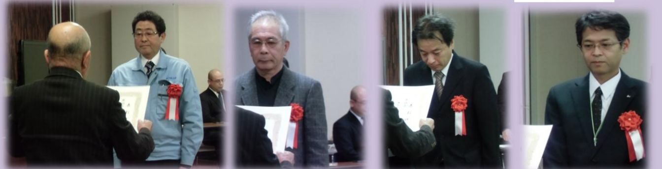
朝日鉄工株式会社 江津出張所