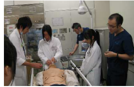
救命救急体験の様子

夏季と春季の年2回実施しており、今夏は松江赤十字病院、公立雲南総合病院、県立中央病院、益田地域医療センター医師会病院に協力を頂き、41名の生徒が受講しました。