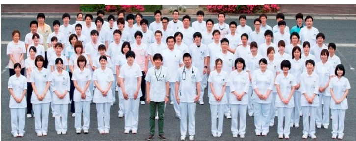
リハビリ専門スタッフ（一部）

棟（38床）をはじめとする精神科病床228床となつています。 在宅療養患者の急変時に対応する在宅療養後方支援病院として、また急性期病棟から治療後の患者