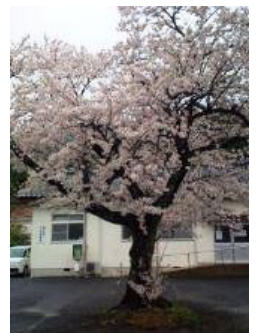
中村診療所の桜 (2015年)

ところで、診療所の駐車場のど真ん 中には古い大きな桜の木が1本ありま す。たくさんの患者さんが満開の桜に