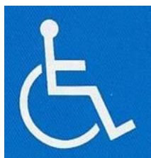
【障害者のための国際シンボルマーク】 所管：公益財団法人日本障害者リハビリテーション協会