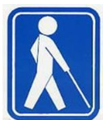
【盲人のための国際シンボルマーク】 所管：社会福祉法人日本盲人福祉委員会