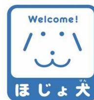
【ほじょ犬マーク】 所管：厚生労働省社会・援護局障害保健福祉部