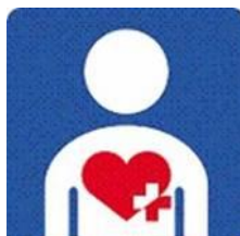
【ハート・プラスマーク】 所管：特定非営利活動法人ハート・プラスの会