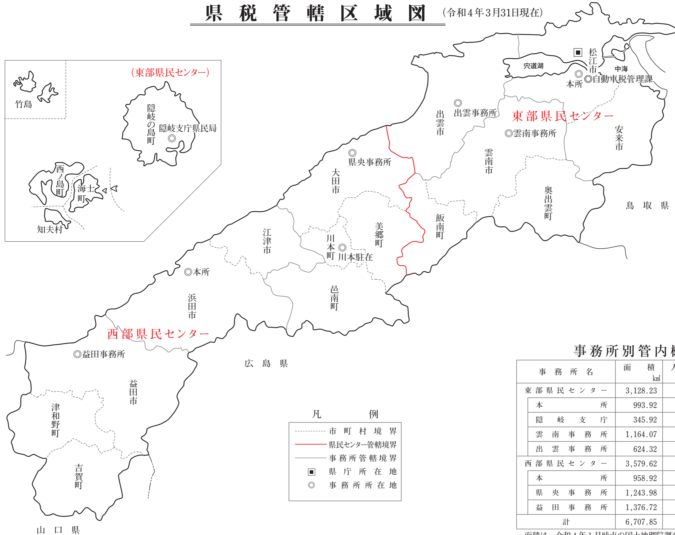
事務所別管内概況