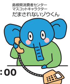
島根県消費者センター マスコットキャラクター だまされないゾウくん