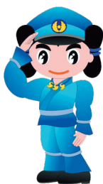
島根県警察 シンボルマスコット みこびーくん