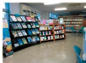
島根県人権啓発推進センター