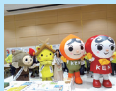
1日人権擁護委員のみなさんと 人権イメージキャラクター 人KENまる君と 人KENあゆみちゃん

当日は約750名の方にご来場いただき、身近な人権問題について、気づき・学び・考える場となりました。