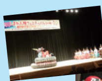
土江子ども神楽団 八岐大蛇披露