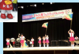
〔オープニング〕 大田小学校ファンファーレバンド