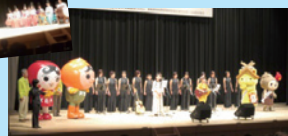
〔フィナーレ〕 「大田市のイメージソング」披露 & フィナーレライブ