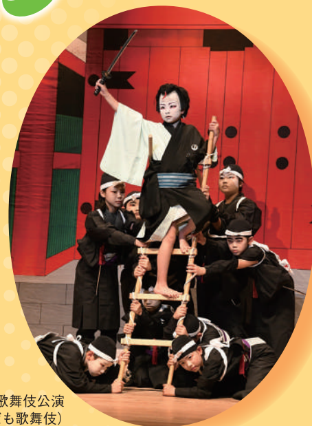
出雲歌舞伎公演 (子ども歌舞伎)