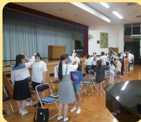
島根県合唱連盟 ワークショップ

を行うことにより、子どもたちの創造力やコミュニケーション力 の向上を図り、将来の文化芸術の担い手の育成や芸術鑑 賞能力の向上につなげます。