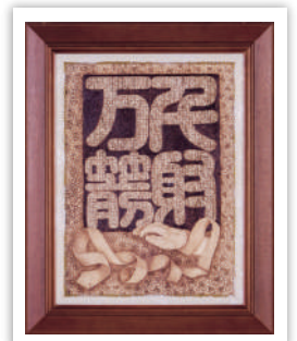
硬筆アート(知事賞受賞作品)