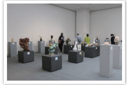
第55回島根県総合美術展

移動展 2月29日(木)～3月3日(日) / 島根県芸術文化センター グラントワ(益田市)