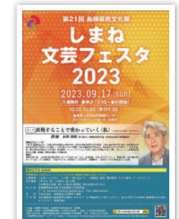
しまね文芸フェスタ2023