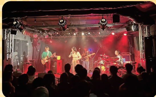
サウンドライブしまね