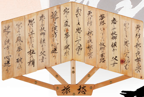
割箸 「旅愁」大瀧 勝久