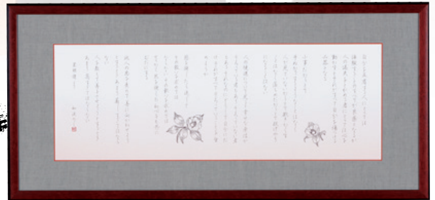
デスクペン 「菜根譚より」加藤 和溪