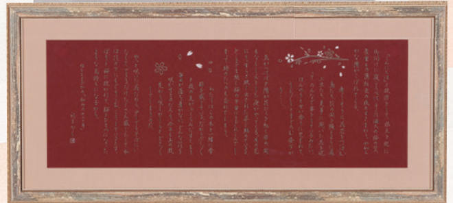
つけペン ねもとまじかの「和みの12ヶ月」石川 礼子