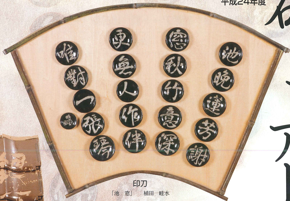
印刀 「池 窓」 植田 畦水