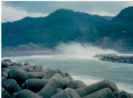
飛沫の様子（隠岐の島町）

基本的に現状の汀線（水際線）を保全・維持することを防護水準とするが、侵食が著しく背後地に被害が生じる可能性が高い場合のほか、砂浜による消波機能を考慮した面的防護を必要とする場合には、汀線の回復を図ることを防護水準とする。