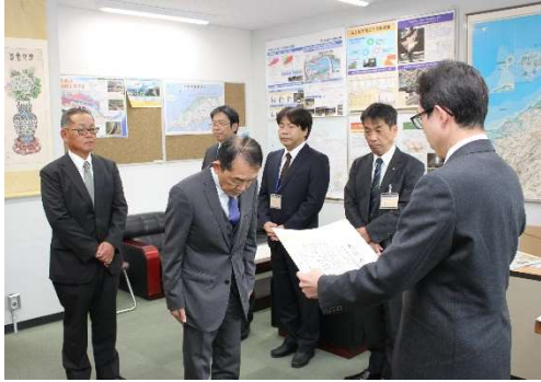
〔写真〕 表彰状授与の様子