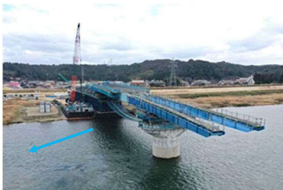
送り出し状況（手延べ機）