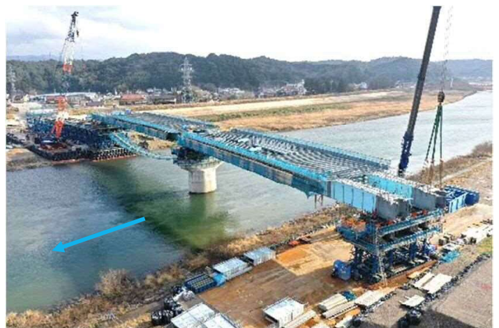
送り出し架設完了