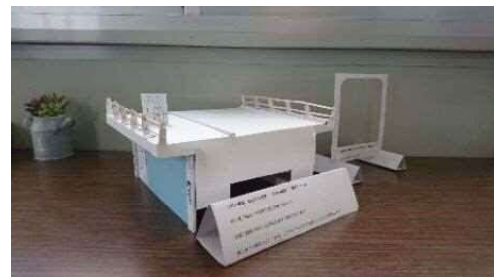
縮尺1/50模型（紙等で益田県土X製作）