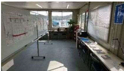
橋の関連本も多数（窓越しに現場を一望）

図面や工事中の写真、橋に関連する書籍、模型など大人も子供も橋に興味をわくように工夫した展示がしてありますので、どうぞ気軽にお立ち寄り下さい。