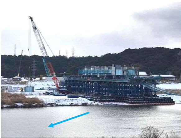
送り出し準備（桁の組立作業）