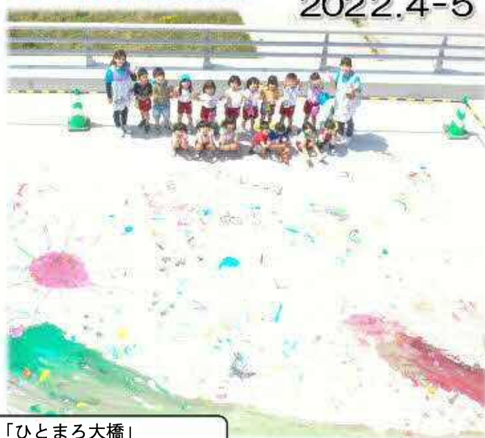
(都)元町人麿線「ひとまる大橋」 ～ 地元保育園児による橋面お絵描きイベント ～