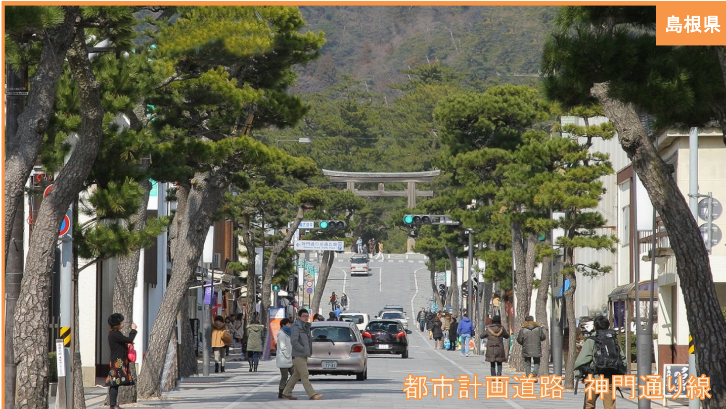
都市計画道路 神門通り線