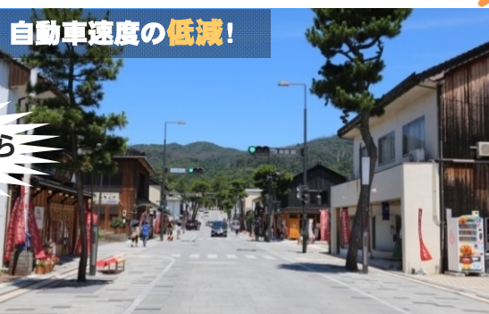
歩行空間3.5m+車道5.0m+歩行空間3.5m