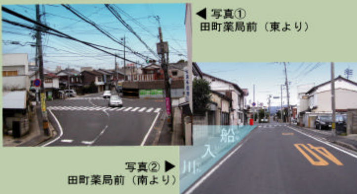
◀ 写真① 田町薬局前 (東より)

現在の田町薬局の西側には、船入川 ふないりがわ という堀があり、鎗場橋という橋が架かっていました。橋は、堀の埋立により小さくなり、現在なくなっています。