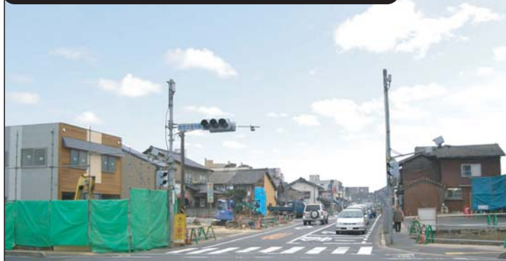
電線がなくなっただけで空がスッキリ見える。