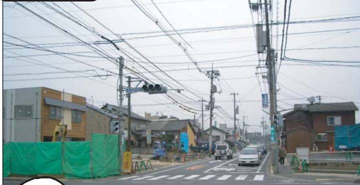
国道431号米子町交差点付近